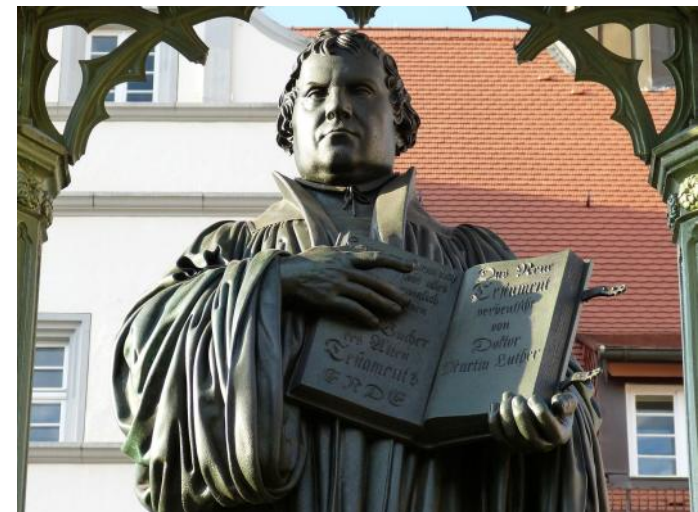
Statue von Martin Luther