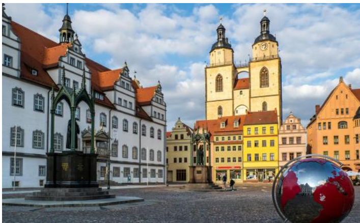
Marktplatz von Wittenberg

Anreise in Eigenregie und Check-In im Hotel Martas*** bis 11.30 Uhr – die Zimmer sind ab 15.00 Uhr bezugsfertig, das Gepäck kann in der Zwischenzeit deponiert werden. 12.00 Uhr Begrüßung, Kennenlernrunde und Programmgespräch. Einleitender Vortrag Stadtgeschichte Wittenbergs. Mittagspause und Möglichkeit zum Zimmerbezug. Nachmittags Stadtführung durch die Lutherstadt. Anschließend gemeinsames Abendessen.