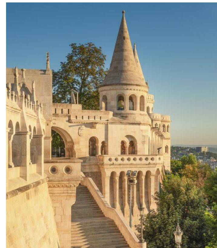
Fischerbastei in Budapest