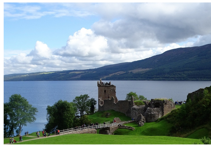
Urquhart Castle am See „Loch Ness“

Frühstück. Vormittags Stadtführung durch Edinburgh – entdecken Sie die hügelige Hauptstadt Schottlands. Anschließend Besuch des Parlaments (angefragt) – werfen Sie einen