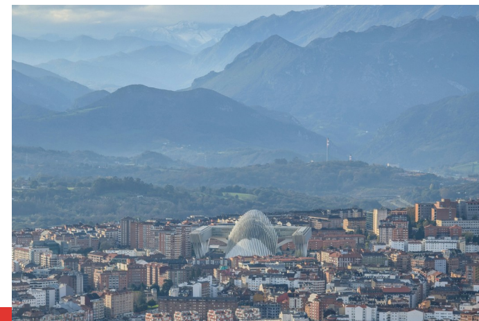
Oviedo am Fuße des Kantabrischen Gebirges

Reisebedingungen: https://tinyurl.com/AG-Reisebedingungen