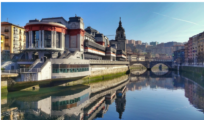
Altstadt von Bilbao

Frühstück. Morgens Stadtführung. Anschließend Empfang im