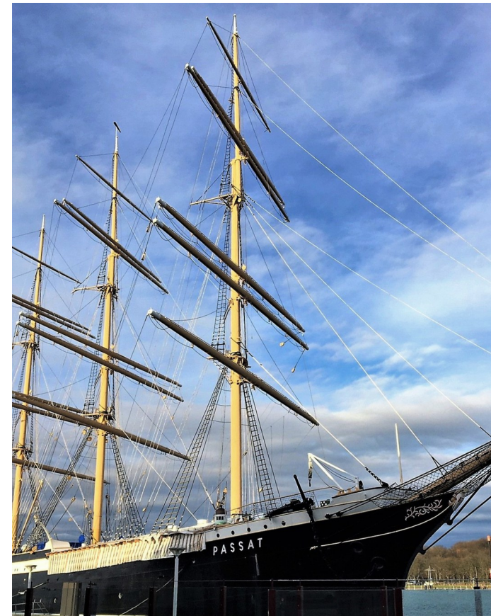
Museumsschiff „Passat“ in Travemünde

Reisebedingungen: https://tinyurl.com/AG-Reisebedingungen