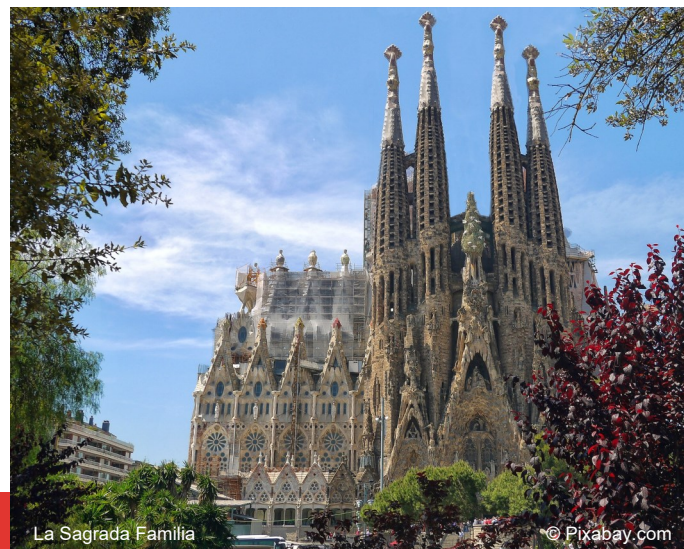
La Sagrada Família