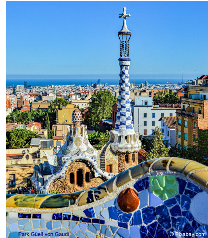
Park Güell von Gaudi

20. – 24. Oktober 2025 Prog.-Nr. 5-25-043-p