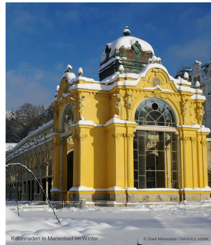
Kolonnaden in Marienbad im Winter

26. – 29. November 2026 Prog.-Nr. 5-26-016-p