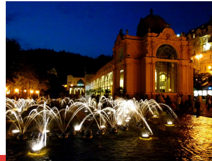
Die „singenden Fontänen“

Reisebedingungen: https://tinyurl.com/AG-Reisebedingungen