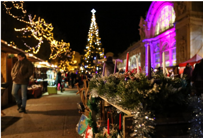
Weihnachtsmarkt in Marienbad

07.00 Uhr Abfahrt in Dortmund, 07.45 Uhr in Werne und 08.15 Uhr in Hamm. Fahrt in Richtung Süd-Osten und zwischendurch Frühstücks-Picknick. Nachmittags Ankunft in Marienbad und