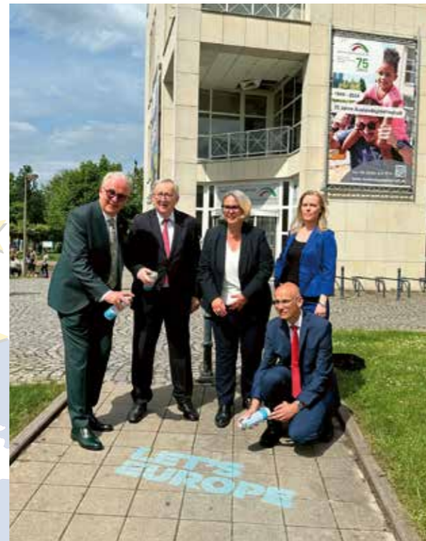
Der Europäer Jean Claude Juncker (2.v.l.) war im Mai 2024 zu Besuch in der Auslandsgesellschaft.