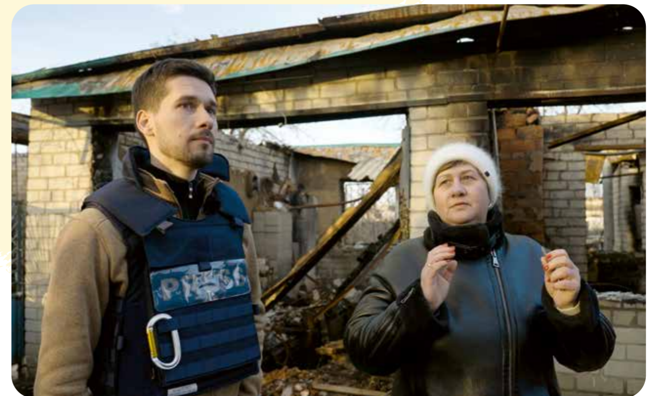
Golod spricht mit einer Ukrainerin im Kriegsgebiet

Die Sicherheit seines Teams steht an erster Stelle: „Wir sitzen nicht für das beste Bild im Schützengraben.“