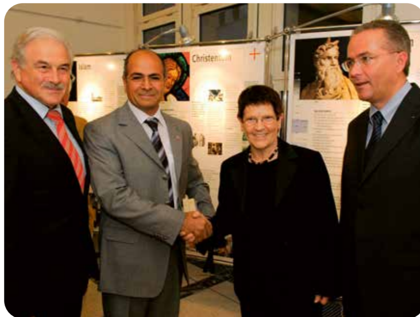
Prof. Dr. Rita Süßmuth eröffnet die Ausstellung „Weltethos – Der Begriff der Weltreligionen zum Frieden“ am 4. 9. 2008.

Alle, die sie erlebt, ihre Positionen geteilt haben und mit ihr für eine gerechtere Welt eingetreten sind, werden sie nie vergessen. Wir trauern um eine sympathische Frau von außergewöhnlichem Format und bewundernswerter Persönlichkeit. (EGF)