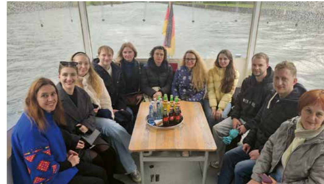
Ausbildungsinteressierte beim Besuch im Dortmunder Hafen

Ausbildung zu kombinieren). Die Zeitmodulle dabei sind unterschiedlich: Entweder zwei Tage im Unternehmen, drei an der Hochschule oder beides jeweils im Block. Die Semesterferien fallen dann weg. Dafür steht am Ende die Qualifikation der gesuchten Fachkraft.