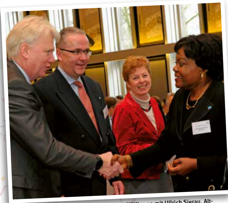
Deutsch-Afrikanisches Wirtschaftsforum NRW 2012 mit Ullrich Sierau, Alt-OB Stadt Dortmund, I.E. Clementine Shakembo Kamanga, Botschafterin der Demokratischen Republik Kongo, Dr. Angelica Schwall-Düren, Ministerin für Bundesangelegenheiten, Europa und Medien des Landes Nordrhein-Westfalen